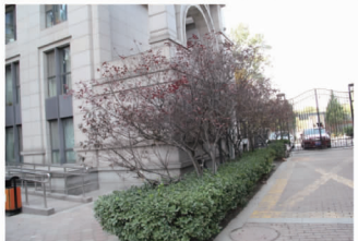
芳园南里(全阴, 小区, 夏季)