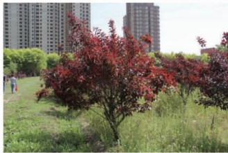
白鹿公园东门入口(全光, 公园, 春季)

很大差别。半阴环境下中部叶片、老叶叶色变绿,顶端新叶紫红色;全阴光照环境叶色基本偏绿色。最佳观赏期为 4 月中旬到 6 月底,7 月开始新生叶仍为亮丽的红色,底部老叶或受光较少的一面转为暗紫色或绿色。