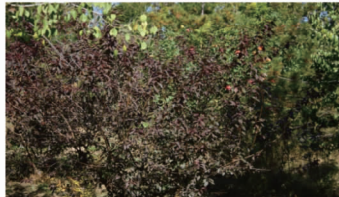
东郊森林公园(半阴, 公园, 秋季)