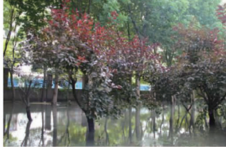
白鹿公园东门(半阴, 公园, 春季)