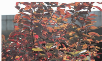
北二环国际商务大厦(半阴, 绿地, 秋季)