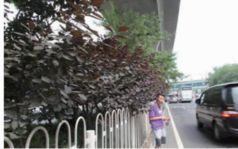
大屯路时腾酒店对面(半阴, 道路, 夏季)