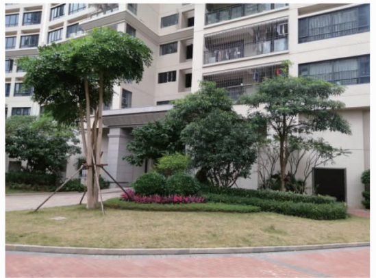
图4 某小区主入口处侧面植物节点景观