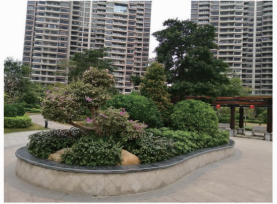
图3 某小区主入口处花坛型植物节点组团

视率,从而驻足欣赏、拍摄取景并进行免费的广告宣传,从小区庭院营销角度来讲即获得了无形的商业价值和广告效应。但是并不是每个环境的主入口都可以做植物节点组团景观,如主入口处有标志景墙或大型标志石时,植物只能起点缀和配景作用,宜少而精,简洁明了(图3、4)。