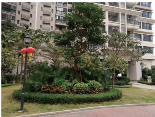
图6 某小区主要视线处植物节点景观