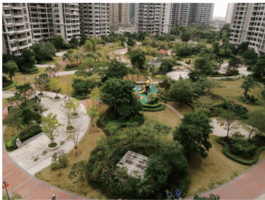
图5 某小区庭院植物节点组团景观

流畅,在不妨碍行车视线的前提下设置造型的桩景树、球灌木、花带草坪和景石等,同时可根据地方环境场景设置一些具有地域文化特色的植物,体现一定主题文化的植物景观。