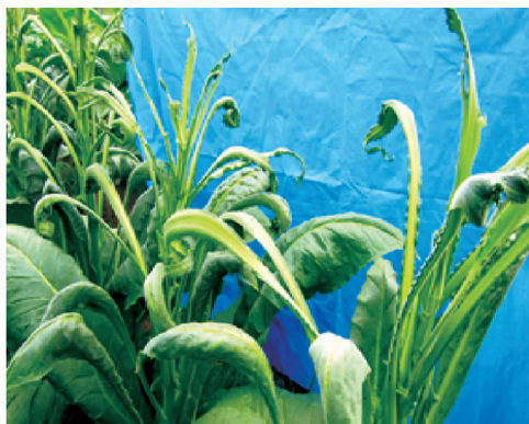
图 2 受二氯喹啉酸伤害的烟株

二氯喹啉酸在烟株上的药害表现为:叶缘向下弯曲、叶片皱缩变厚(图 2),随二氯喹啉酸田间浓度增大,叶宽逐渐变窄甚至呈鼠尾状,叶片前端分叉;整株烟失去顶端优势,在田间分蘖生长,严重者可分 5~6 蘖。叶片总厚度、上表皮厚度、下表皮厚度、栅栏组织和海绵组织厚度较正常叶片都增厚,茎的表皮厚度、导管直径、髓面积较正常烟株均小 [22] 。张倩 [23] 在田间测定二氯喹啉酸使用量 5 a. i. g/hm 2 时,烟株开始表现出受害症状,但经过一段时间的生长还能自行恢复;但当田间施用浓度达 20 a. i. g/hm 2 时,烟株生长受到明显抑制,叶宽变窄;当达到 60 a. i. g/hm 2 时严重影响烟叶的产量和品质,甚至绝收。