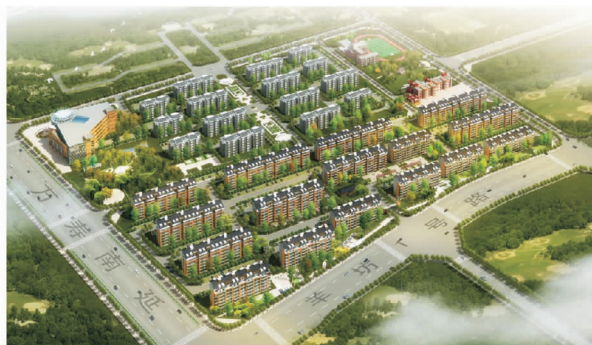
图1 高立庄新村规划鸟瞰

高立庄新村位于北京市丰台区花乡南部区域内,地处万寿路南延东侧,北依世界公园万亩旅游区,南邻京良公路绿化隔离带,处于城市绿化环带之中,环境优异,地理位置优越(图1),周边公共实施较齐全,区域环境良好,农业户口840户,人口2 477人。高立庄新村总土地面积262.39 hm 2 ,总建筑面积27.53万m 2 ,其中,住宅面积24.79万m 2 ,小学和学龄前教育用地1.24万m 2 ,配套商业用地1.60万m 2 。2003年被纳入绿化隔离带建设的重点地区,根据北京市绿隔政策,全村村民将回迁安置、整体上楼。新村项目2009年5月开工,2012年通过验收。